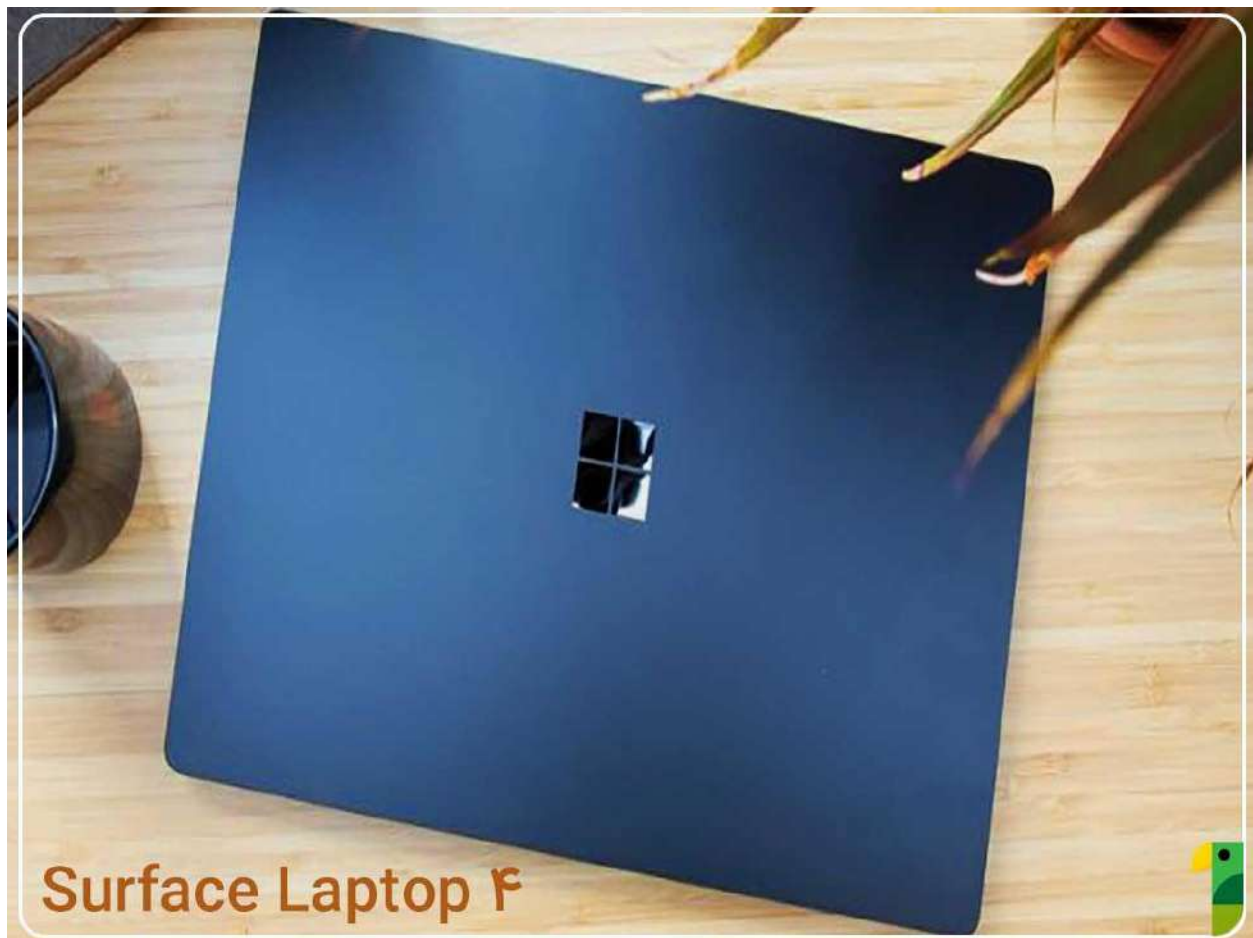
Surface Laptop 4